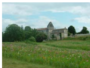
Point de vue sur l'église