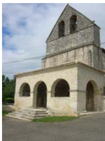
Eglise Saint Martin

> Longer le mur du cimetière en direction de la D128. Suivre la départementale par la gauche pour traverser au passage protégé (prudence), rejoindre le parking.