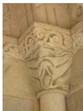
Détail du portail de l'église Saint Martin