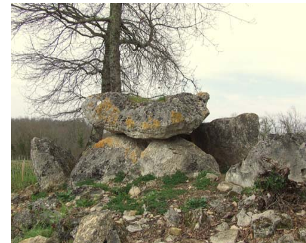
Dolmen de Curton