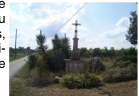
Croix de mission

> Prendre le chemin à gauche, à la croix de mission (balise), suivre le chemin de terre dans les vignes jusqu'à l'église Saint Martin. A la balise au bout des rangs de vignes, tourner à gauche. A la balise suivante tourner à droite vers l'église.