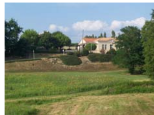
Point de vue sur la mairie