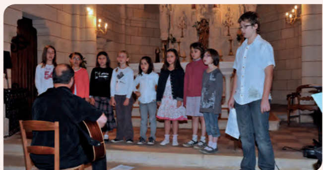
« Les gens sortent bouche bée de l'église avec les yeux encore brillants ! »

Les répétitions sont différenciées entre les adultes et les enfants et tous ont grand plaisir à se retrouver lors des concerts ! Musiques canadiennes, québécoises, françaises, des pays de l'Est et bien d'autres styles sont au programme.