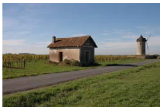
Vue sur le moulin de Lescours