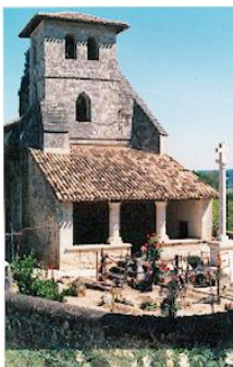
Eglise St Aubin

Les châteaux et demeures du Bedat, du Prieuré et de Conques sont des propriétés privées et ne se visitent pas.