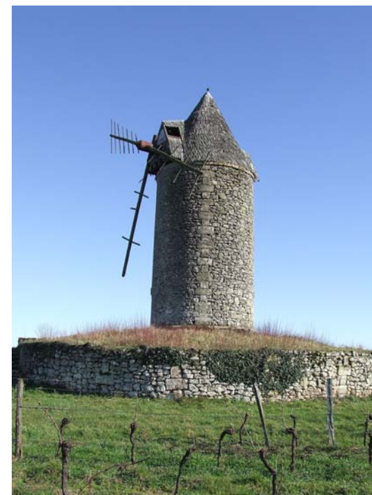
Moulin de Lescours